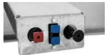
Bremssystem mit Federspeicher-Feststellbremse