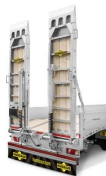
Massive Stahl-Auffahrampen mit Weichholzbohlen