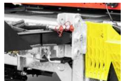
3 Lagerpositionen für die Zugdeichsel

*Sicherheitshinweis! Die Verwendung der Anhänger darf nur unter ausdrücklicher Beachtung aller straßenverkehrsrechtlichen, berufsgenossenschaftlichen und ladungssicherungstechnischen Vorschriften erfolgen. Alle Angaben ohne Gewähr! Für Irrtümer und Druckfehler wird keine Haftung übernommen. Technische Änderungen vorbehalten. Alle Maßangaben sind ca. Werte und beziehen sich auf das Serienfahrzeug ohne Zubehör. Zusatzausstattung verändert das Eigengewicht und die Nutzlast. Abbildungen ähnlich, können auf preispflichtiges Zubehör enthalten.