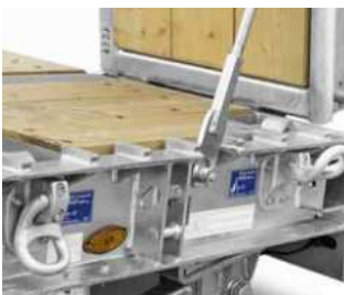
Kletterleisten am Außenrahmen im Bereich der Auffahrtsschräge