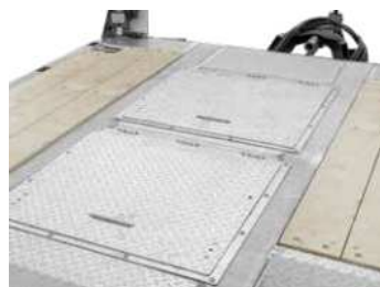
2 versenkte Werkzeugkästen mit Deckel