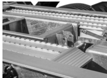
Optionale Aluminium-Auffahrampen mit patentierter Verriegelung