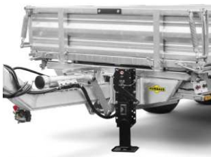
Stahl-Stirnwand, nach vorne abklappbar