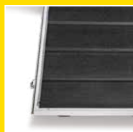
Heckklappe mit Trittleistengummi