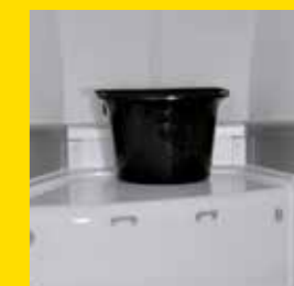
Ein abnehmbarer Futtertrog – an der Front verstaubar