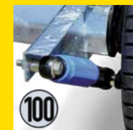
Radstoßdämpfer mit 100 km/h Bestätigung (bezieht sich auf die deutsche SVV)