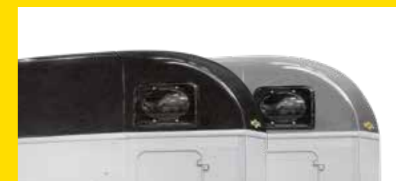
Haubenfarbe schwarz / silber

Weitere Haubenfarben laut Zubehörprogramm