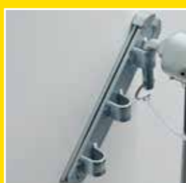
Dreifach längen- und höhenverstellbare Brust- und Heckstangen