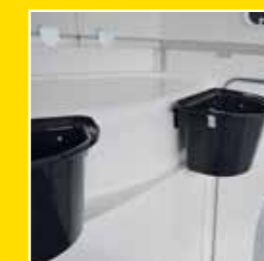
2 abnehmbare Futtertröge – an der Front verstaubar