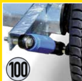
Radstoßdämpfer mit 100 km/h Bestätigung (bezieht sich auf die deutsche SIV0)