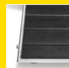
Heckklappe mit Trittleistengummi