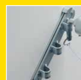
Dreifach längen- und höhenverstellbare Brust- und Heckstangen