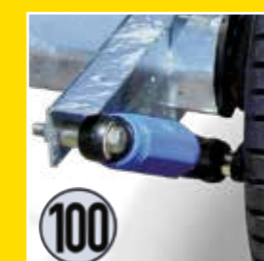
Radstoßdämpfer mit 100 km/h Bestätigung (bezieht sich auf die deutsche SIV0)