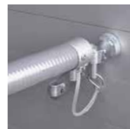
Dreifach verstellbare Brust- und Heckstangen