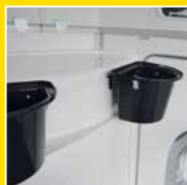
2 abnehmbare Futtertröge – an der Front verstaubar