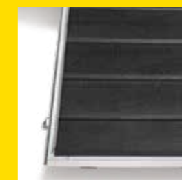
Heckklappe mit Trittleistengummi